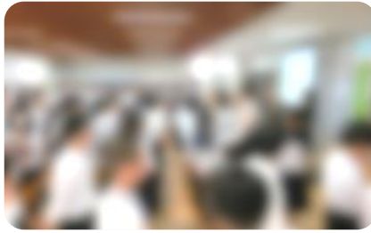
クイズ形式で性について考える生徒たち