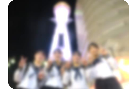
● 4組「姫路城・南京町コース」(広島駅=🚗=姫路駅=姫路城=神戸・南京町(夕食=ホテル)