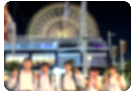
● 3組「道頓堀・通天閣コース」(広島駅=🚗=新大阪駅=道頓堀散策=パルクール=新世界(夕食=ホテル)