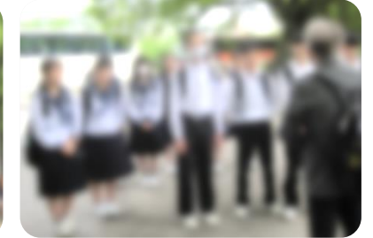
● 1組「宮島・厳島神社コース」(宮島口=🚗=宮島=🍰=宮島口=夕食=広島駅=🚗=新神戸駅=ホテル)