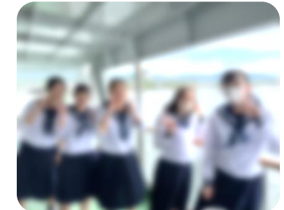
● 2組「大阪城・海遊館コース」(広島駅=🚗=新大阪駅=大阪城=海遊館=天保山マゼット ® レイン(夕食=ホテル)